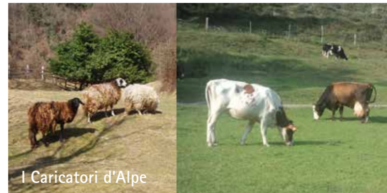
I Caricatori d'Alpe

L'allevamento del bestiame caratterizzò questa località prima ancora dell'agricoltura. Ad Alpe di Megna era attiva una stazione di monta per bovini ed equini di cui oggi vediamo qualche resto sotto il voltone di ingresso della corte principale (foto sopra). Qui prestava la sua opera uno dei cinque Caricatori d'Alpe noti al censimento del territorio valbronese dei primi del novecento. I "Caricatori" erano contadini/allevatori che guadagnando nei mesi estivi le località di pascolo venivano incaricati di accudire mandrie composte da bestiame privato; era infatti naturale che la stragrande maggioranza delle famiglie possedesse almeno una vacca e si preoccupasse di mandarla al pascolo per tutta la bella stagione. La vacca partiva dopo un lungo periodo di ricovero nella stalla di corte, dove il più delle volte partoriva e il trasferimento al pascolo garantiva un ritorno ad un ambiente naturale, tra i suoi simili e spesso anche una nuova gravidanza.