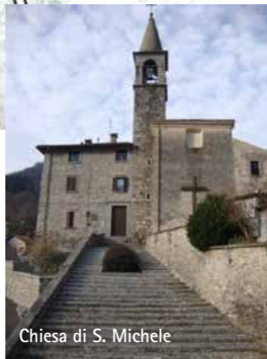
Chiesa di S. Michele

Merita una visita la chiesa di San Michele, a Visino: per la struttura, l'ubicazione e per i tesori d'arte che custodisce, tra cui un dipinto di Andrea Appiani e un polittico del Bergognone.