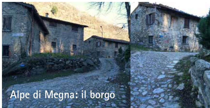
Alpe di Megna: il borgo