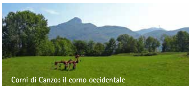
Corni di Canzo: il corno occidentale

Considerati veri e propri monumenti dell'era glaciale, sono oggi protetti da una legge regionale, ma per millenni sono stati scalpellati, sfruttati e riutilizzati come materiale da costruzione per farne are sacrificali, cippi stradali, marciapiedi, architravi, stipiti di portoni, capitelli, oppure strumenti di uso quotidiano come macine per cereali o legumi. Particolarmente grande e stratificato è il masso a ridosso della fontana di Megna, nella foto qui sopra a destra ripreso posteriormente, così come si presenta all'arrivo al borgo.