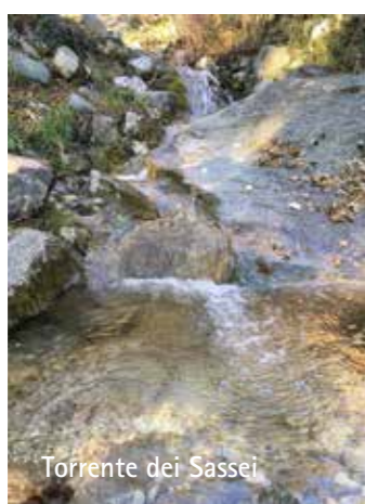
Torrente dei Sassei

La conservazione di questa soluzione rappresenta una primitiva e piccola opera di ingegneria: l'ingresso delle acque nella mulattiera è irrobustito e canalizzato da una sorta di argine, un piccolo tetto o ponte, (foto qui sopra a destra) che ha anche la funzione di frenare eventuali trasporti detritici prima della loro caduta sul sentiero. L'opera di consolidamento del canale centrale contiene e convoglia le acque e contemporaneamente consente a tutti il passaggio, anche a piccoli trattori o mezzi di lavoro (che qui di certo non rischiano di restare prigionieri del fango). Infine, il deflusso dalla mulattiera nel naturale scorrimento verso valle è là dove il torrente diviene anche confine tra differenti proprietà.